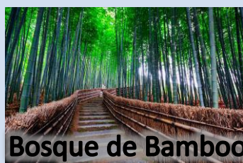
Bosque de Bamboo