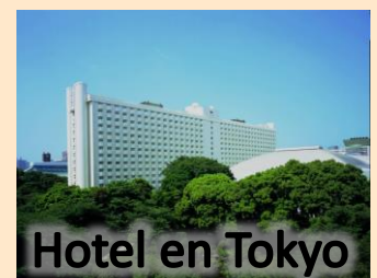
Hotel en Tokyo