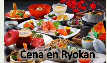
Cena en Ryokan