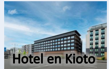
Hotel en Kioto