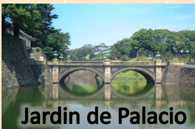
Jardin de Palacio