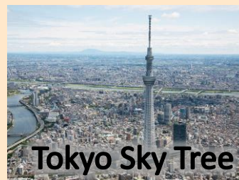
Tokyo Sky Tree