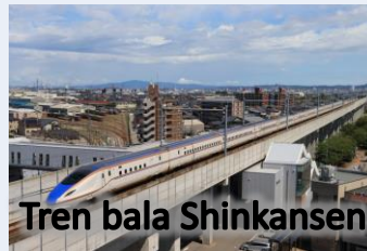
Tren bala Shinkansen