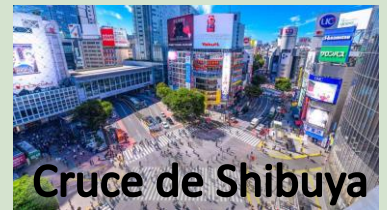
Cruce de Shibuya