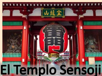
El Templo Sensoji