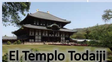
El Templo Todaiji