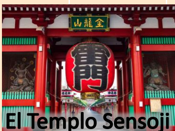
El Templo Sensoji