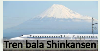
Tren bala Shinkansen