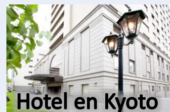
Hotel en Kyoto