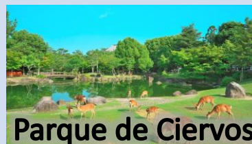
Parque de Ciervos