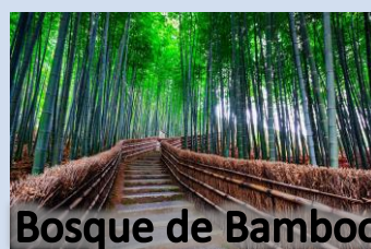
Bosque de Bamboo