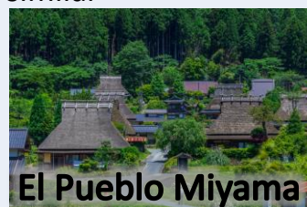
El Pueblo Miyama