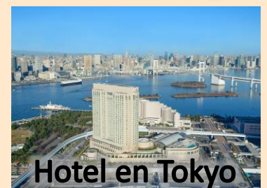
Hotel en Tokyo