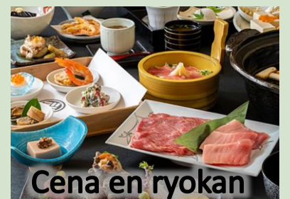
Cena en ryokan