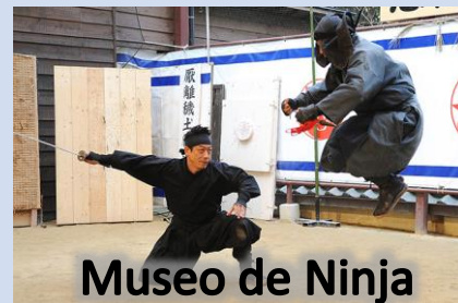
Museo de Ninja