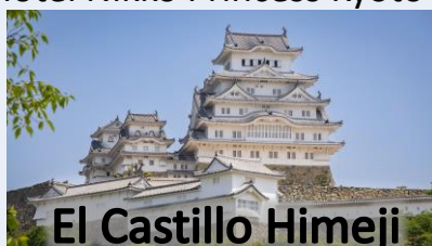
El Castillo Himeji