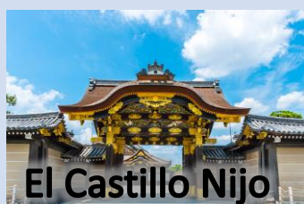
El Castillo Nijo