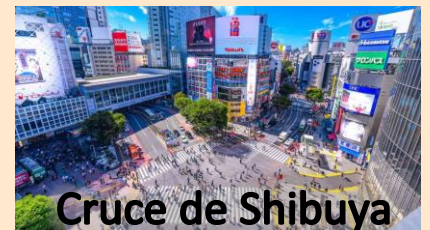
Cruce de Shibuya