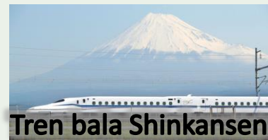
Tren bala Shinkansen