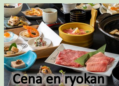
Cena en ryokan